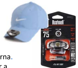
Bushnell Cap Light Uses 1 AAA battery Walmart